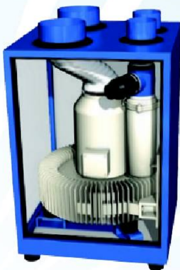
Vysokopodtlaková jednotka HV-S

MV je tichý, osvedčený a dizajnovane nevykypujúci zdroj napájania.