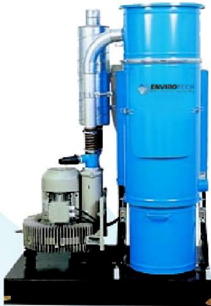
Odsávacia jednotka ALPA-5.5-S

Kompaktná odsávacia jednotka s prachovým separátorom, ventilátorom a kontrolnou jednotkou, určená pre malé mechanické dielne. Odsáva prach, dym a výpary od zvarovania, brúsenia, leštenia a pod. Určený je k nej Filter triedy BIA-C.