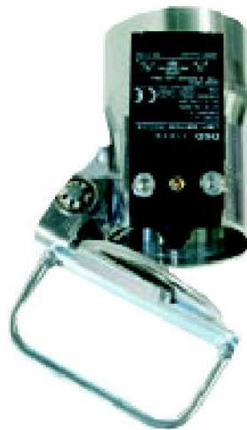
Škrtiaca klapka MDKM S mikrosplína om.