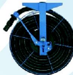
Hadicový navíjak VRAA Pre čistenie a vysávanie.