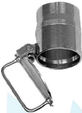
Škrtiaca klapka MDKB z pozinkovaného plechu. Používa sa na spojenie s hadicami MDKS.