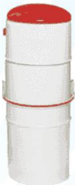
Vakuový ísti KPEA Centrálny vákuový ísti , vyrobený z glazúrovanej ocele. Pre domácnosti a malé prevádzky.