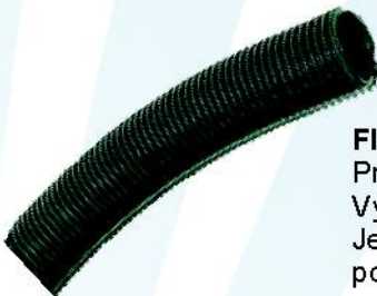
Flexibilné hadice Prehľadné polyuretanové. Výplet tvorí vystužené PVC. Jednoliatý antistatický polyuretan.