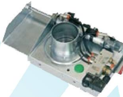
Automatická klapka na stlačený vzduch SBBB. 2-3 mm elektrogalvanizovaná oce .