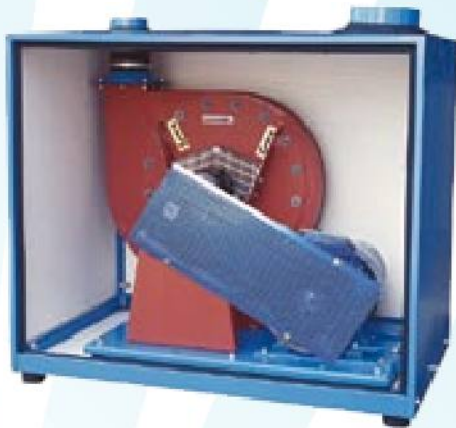
Strednotlaková jednotka MV

Pripojenie 3-fázovým EEC-spojením so zariadením.