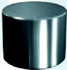
Koncovka MDED Galvanizovaná