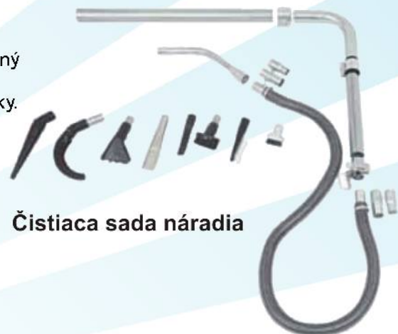
Čistiaca sada náradia